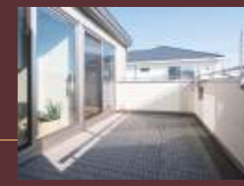
※掲載写真はすべて2022年2月撮影。